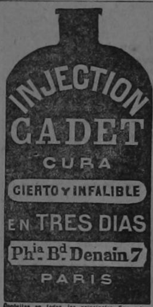
Disponibles en todas las principales Farmacias.